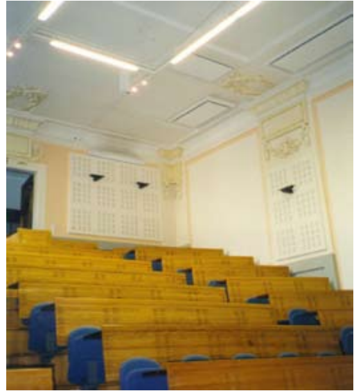
Расположение приборов на потолке – лучшая защита от несанкционированных контактов.